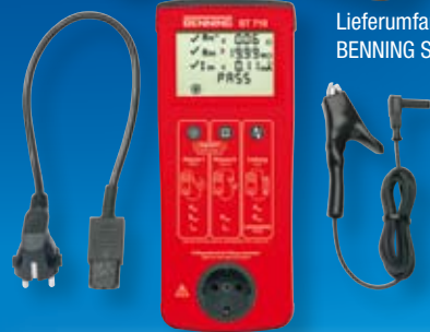
Lieferumfang BENNING ST 710